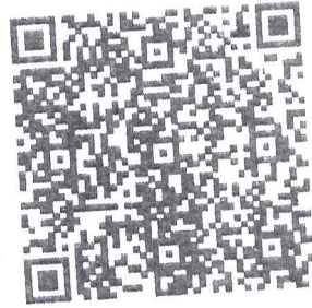
Este documento es una representación impresa de un CEDI