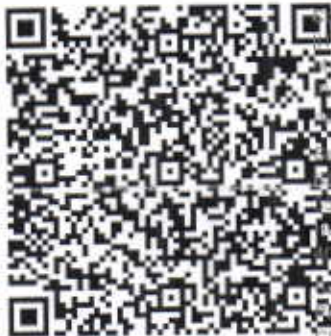
Imagen Original del complemento de Certificación Digital del SAT

1|a7c09f02-a329-4401-8b4f-1ce818582a92|2020-02-07T23:12:07|LSO1306189R5|NOU/+Y|Mp6iOrgQEhJq4nN0R7YQwXkxR2t1qjFh5b 3DLq60uJRXR+OBWqs1G8wRSKYD|QWGXGCM73G2uB3vHOCv1JTuy7RNHrPaE35pIH26aCTLw89xonZMLrSsDDUMCaF/U/qHhz3tGul WCCJQQB5l6xhPtd0+VNihO/LU6sAKBx0h5KoN4BVzTGfcZa2CZQgAyQHlqxAfg1mHUMcuRwbyKT1hgT4+HbWPPiaR3cYzyWwg|QNB6xiZ 07Xng6ZBvuPS1CwIU6/PkRGPpsFukpWH2j9lpw/oy21OjR3s8pyfpgxZM51V16RdE40FD+ex/p2FCJA27WQ==|00001000000408254801|