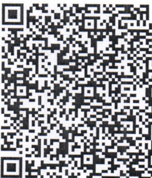
Imagen Original del complemento de Certificación Digital del SAT 56bf33b9-7b44-4944-b010-3f77425fdfe9|2020-07-21T18:08:34|LSO1306189R5|dS8F60G94XpSIIMtfkHIA7fA6bp12JpFY... Número Digital del CFDI F60G94XpSIIMtfkHIA7fA6bp12JpFYnCTuxXuIEGdbAhl8J5RMic0fa6+MjLuzlygSu+2SdmQq718+NqmF8QBel5nwg9+... Sello Digital del SAT LKDz52+Dp5pig6mS5PXRT21tt+NsgCnzzDhXlqEjSPXivniq+oF6kjH/xlyuakGHU8GMpz7HugpS6CsERiub0GSxlaEi0ZEJd...

Forma de Pago: 01 - Efectivo Método de Pago: PUE - Pago en una sola exhibición Banco: Cuenta: Condiciones de Pago: