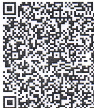
Imagen Original del complemento de Certificación Digital del SAT

24fd82a8-8b37-49e2-974e-1fe107c3df63|2020-07-27T15:38:41|LSO1306189R5|By5nnpdGLxEFDPvhu2F9ip2oA5i7ybILv+r FrQdOuiPfkXBHQglXwTtU1pEFh5PFt8t83MdRI3pvbfaLSkjIt5mcmNAmN9DMoWt7J7/fV4nIIBJ3aH3XqKTndD8ViG0j 3Q+DVcfAtDBzooCHUbkEJx0ESYGgnVtEYUBTbPyHcENRxtSePG17x0VyKtCyIntcGbpLaXR066w8WRyNhMe3uLG+/D UJMaB+wxwfpQ4mkuOTwkXfroY2Lvb5X5FOocSzrs6tFYu7xraSVrtgoVkrNjJra+UZjluJBWleQ2R0I++Z3yCwhto+CON B2UtP9MIIEm5B6RRKAqkQ==|00001000000408254801|