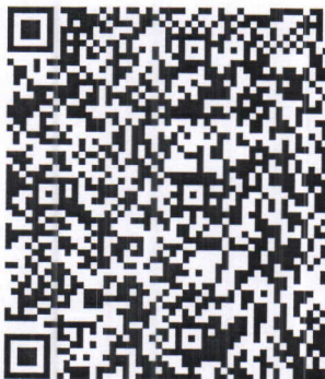
Imagen Original del complemento de Certificación Digital del SAT

ce6ec738-7842-4400-a334-20006cd5e8c4|2020-11-24T18:03:03|LSO1306189R5|IYyKlj2QLcXDGmVoufy8FjibSwquoUiL HgeRaHM1VgEu6f/TrahBFzVdQ1X3zCEchuZBMGsLoODaUo6MfHv1UxX4fmn6jNujxUVccPviYRdWibNuTK7mAGLSOM7R doqXJmNznK4mOiPNUD6lve14I7INI8YWnM1qI1Q3kSu2Vb//UQ87DREzLuy4Eli15JqoEibpM9PPXtxs4j5elputuRD9z30+g 9YK75kc9NUAKhS5H/6FvDKKhQyNjWdBqNaL+jV62nujkZ+1TzZ6uZFW7VSLoyMf2aSXT42FQSYzNXEsvTuvCaNshZFN WpTnjYYo5ZJWimfW2fWhKg==|00001000000408254801|