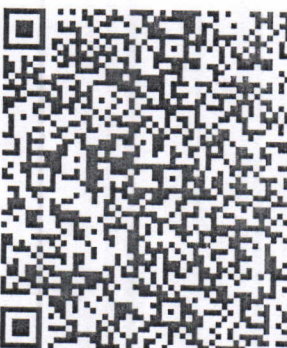
Imagen Original del complemento de Certificación Digital del SAT

e2f91170-9082-4e03-9028-acef262fd3ba|2021-01-19T14:38:31|LSO1306189R5|uJ/8kGAmIzu/4KHqFV1kiRW2AI4sERU2gW6YL49yVDSm2RVhObepol7phkULsnCdbi78yYAEMWYTPxxMoRr/nF8SxJjicfOC4DKRAXHc3ef7MDSpdDPrLszQhexp7QPdk7NYxT/IHcp8qA6wylhZRG3G6N4TbZBF0UTI112zecbd4wBambkct6PUcR9bLg9Rn4afQLN9zHeriaTRpml6rtlx7hwEg2NuZczwPrt8cVh5zNfgZlmlGAFfOKDp+Hz1Dv013GzFJeY5GcJPtLA==|000010000408254801||