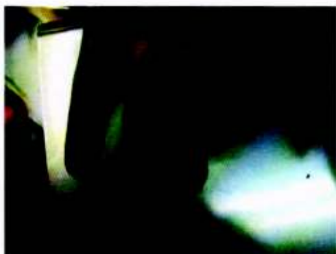
GUANTE MANCHADO ACCEPTABLE